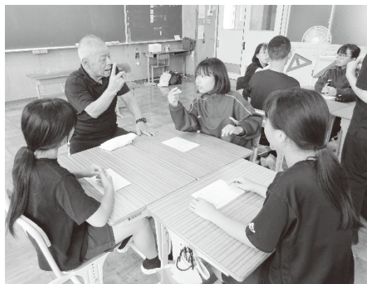
6 福祉協力校助成事業