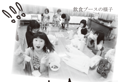
飲食ブースの様子