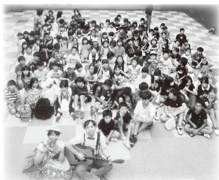
ケッチャップマヨネーズさんとの集合写真