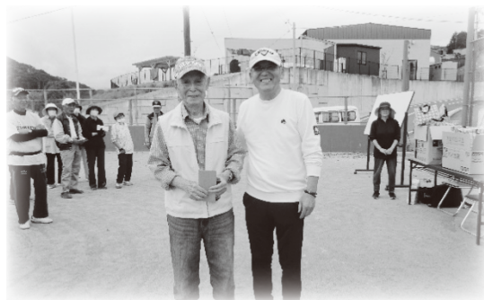
入賞者には豪華景品も！