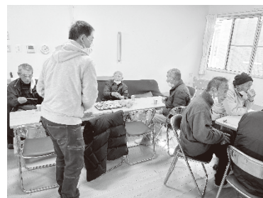
男性も多く集まっています！