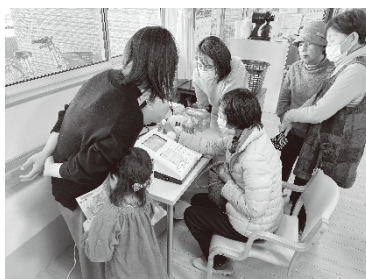
骨の健康度はいかに？