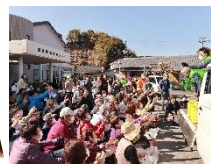
←当日の様子 (左)メインイベント (右)もちまき