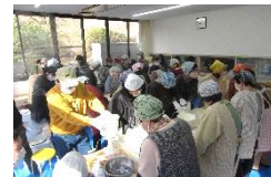
←前日準備 (もちづくり) の様子