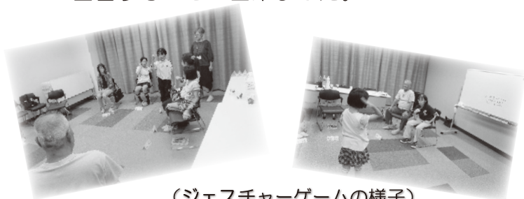
(ジェスチャーゲームの様子)

参加された方は、知らない単語の手話を表現するのが難しそうにされていたり、恥ずかしそうに手話をしていましたが、自分が好きなお題の時は、自信をもって元気に回答することが出来ました。