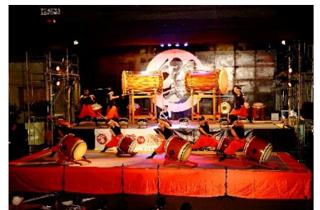
数々のイベントに出演しています