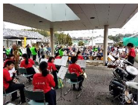
社協つれもてまつり