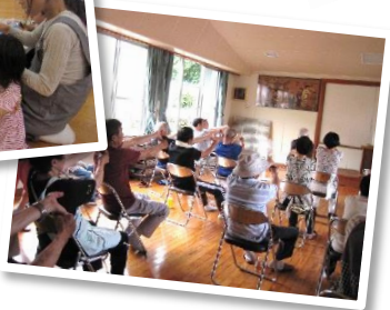
いきいきサロンの様子